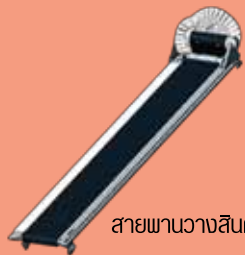
สายพานวางสินค้า