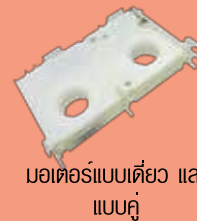
มอเตอร์แบบเดี่ยว และ แบบคู่