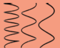
เกลียวสำหรับล็อกสินค้า ขนาดต่างๆ